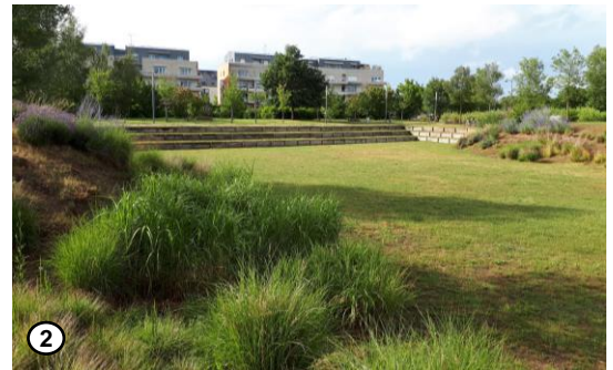
Bassin d'infiltration central du Parc du Larry

Lors du montage du projet, il y a eu une vraie volonté politique de conserver des espaces naturels pour cet aménagement. Les Parcs du Larry et de Saint-Fiacre font partie des circuits de balades à Olivet ce qui montre qu'on peut tout à fait combiner gestion des eaux pluviales et aménagement paysager tout en améliorant le cadre de vie et en facilitant les activités de loisirs et d'aménités.