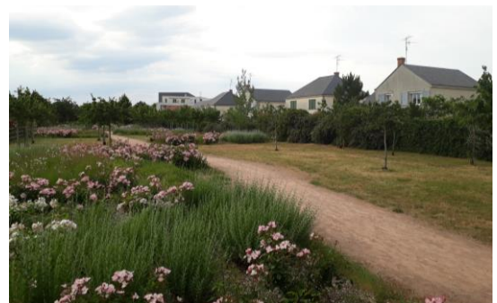
La Promenade des saveurs