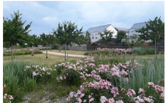
Plantes et diversité végétale