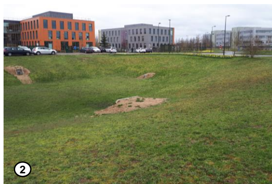
Bassin d'orage devant l'entreprise Axéreal