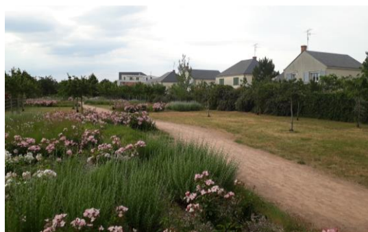
La Promenade des saveurs