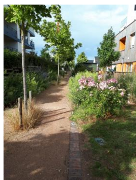
Promenades et venelles