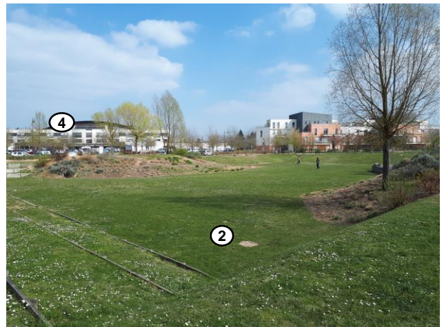
Vue du bassin d'orage du Parc du Larry, théâtre de verdure