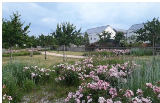
Plantes et diversité végétale