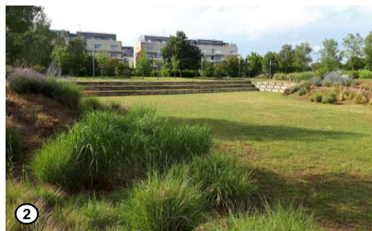
Bassin d'infiltration central du Parc du Larry

Lors du montage du projet, il y a eu une vraie volonté politique de conserver des espaces naturels pour cet aménagement. Les Parcs du Larry et de Saint-Fiacre font partie des circuits de balades à Olivet ce qui montre qu'on peut tout à fait combiner gestion des eaux pluviales et aménagement paysager tout en améliorant le cadre de vie et en facilitant les activités de loisirs et d'aménités.