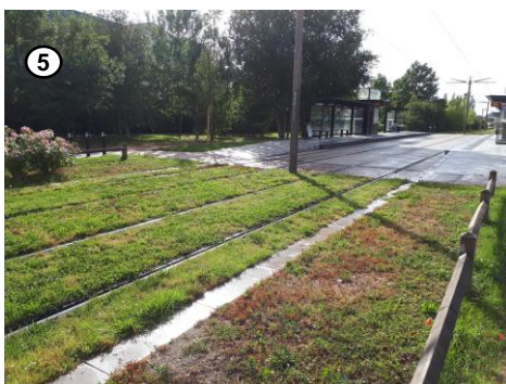
Cheminement piéton et tramway